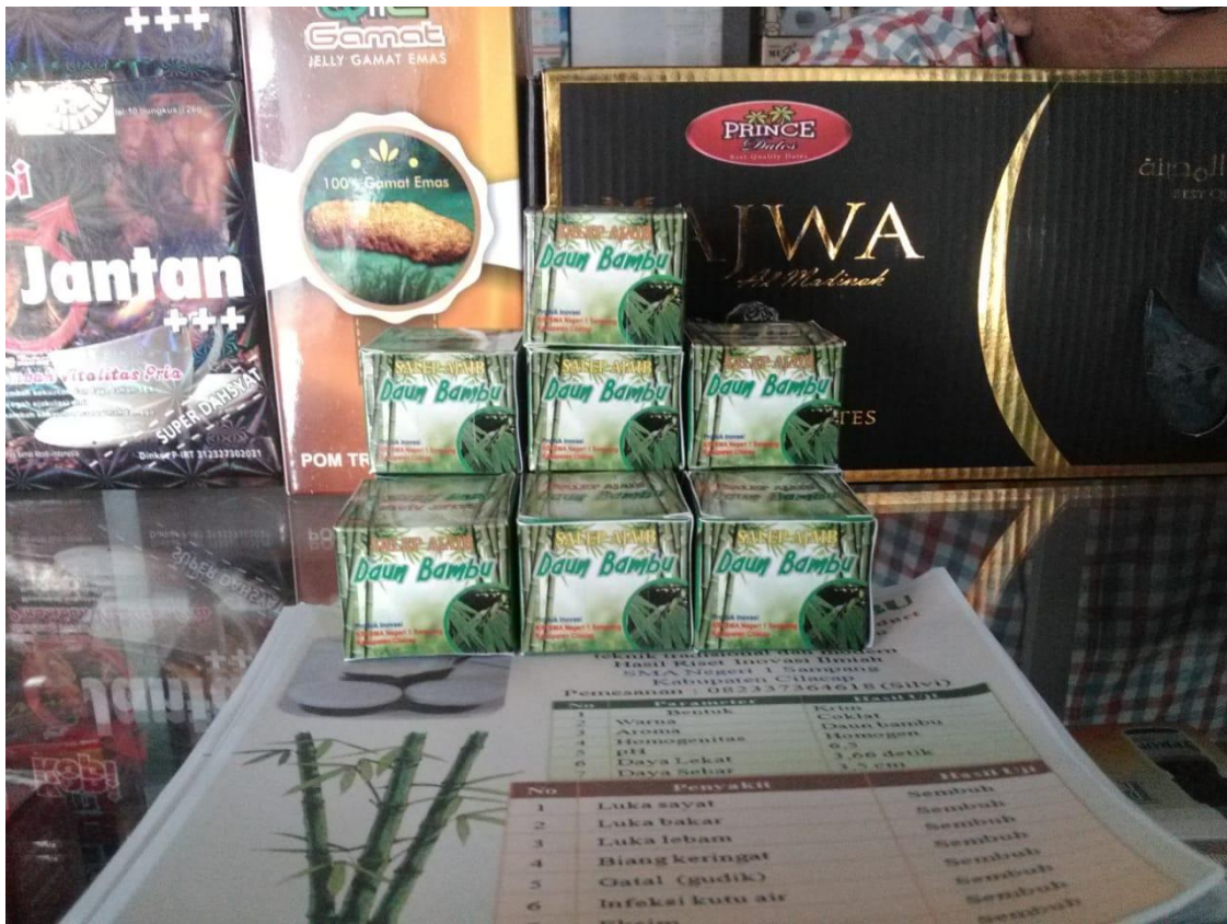
FOTO JUAL BELI DAN JURNAL PENJUALAN